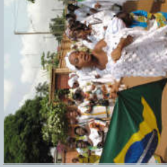
Le reflux de la Diaspora

Les Agoudas sont des afro descendants revenus au Bénin, après avoir quitté le Brésil avant ou après l'abolition de l'esclavage.