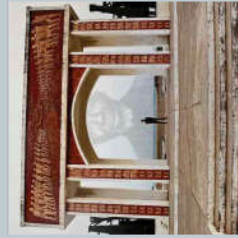
Site mémoriel à Ouidah (Bénin). Exposition PHEONIX

JEUDI 6 JUILLET À 17H (horaire à valider) À L'ESPACE COSMOPOLIS