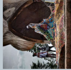
Yahochi - Eric Borttero - 2022 © Eric Borttero

La culture et le patrimoine, leviers de croissance au Bénin DIMANCHE 18 JUIN À 18H00 À L'ESPACE COSMOPOLIS