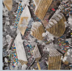
Cité royale - Ile Ife - Julien Sinzogan - 2015. Axylière sur tole, 123 X 143 Cm. Collection privée.

Artistes béninois contemporains entre tradition et modernité SAMEDI 17 JUIN À 18H00 À L'ESPACE COSMOPOLIS